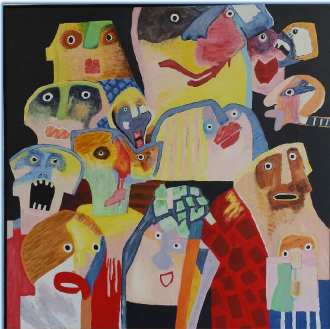
Maleri af SPF 2015 inspireret af Leif Sylvester Petersen